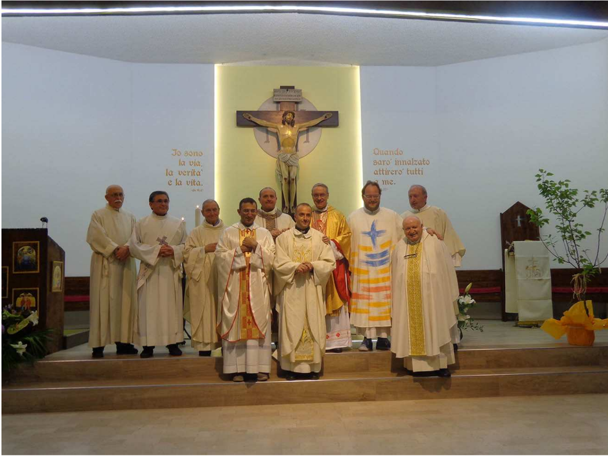
26 maggio 2016 = processione cittadina del Corpus Domini